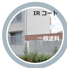
塗布後 13 年経過比較